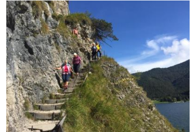
entlang des Achensees