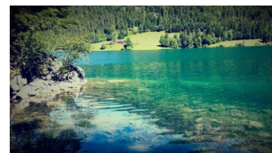
Blick über den Hintersteiner See

Dauer: 4 Std. 650 hm↑ 650 hm↓ Strecke: ca. 11 km