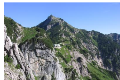
Blick zum Stripsenjochhaus mit dem Stripsenkopf

Eigene Anreise, Mitfahrgelegenheit gegen Aufpreis möglich = Bitte sprechen Sie uns an!