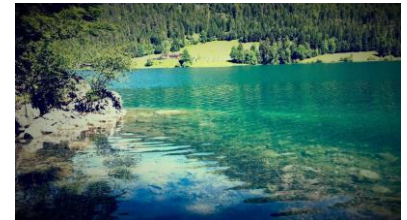
Blick über den Hintersteiner See

Dauer: 4 Std. 650 hm↑ 650 hm↓ Strecke: ca. 11 km