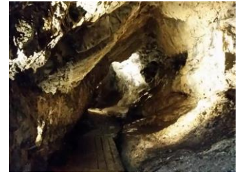
Höhle im oberen Bereich der Rehbachklamm

Dauer: 5 Std. 950 hm↑ 950 hm↓ Strecke: ca. 11 km