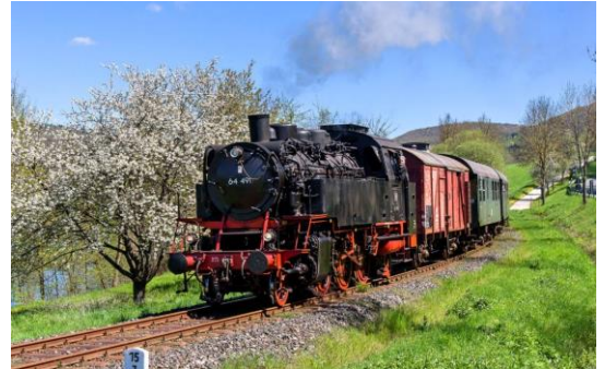
Museumbahn Fränkische Schweiz