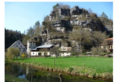
Felsformation bei Muggendorf