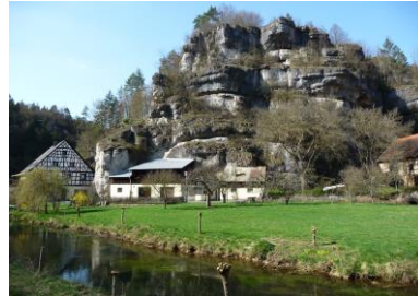
Felsformation im Püttlachtal