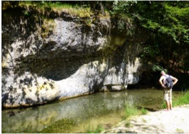
Die Karstquellen im Klumpertal

Wandern, Geselligkeit und Erholung ist unser Ziel für dieses Wochenende in der beeindruckenden Fränkischen Schweiz.