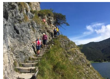
entlang des Achensees