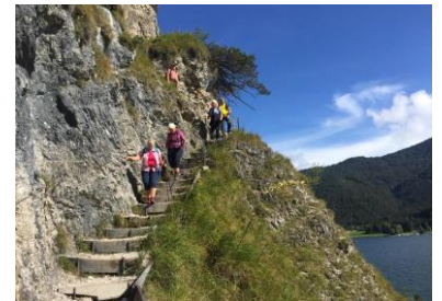
entlang des Achensees